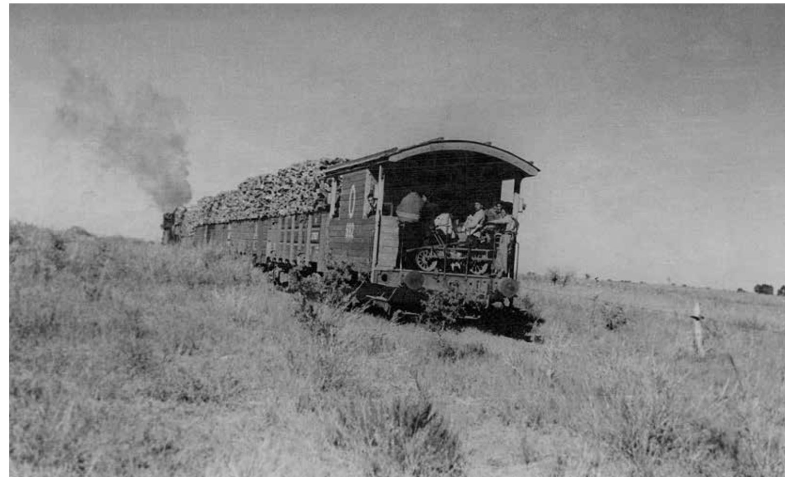
Transporte por tren de la leña de los obrajes.