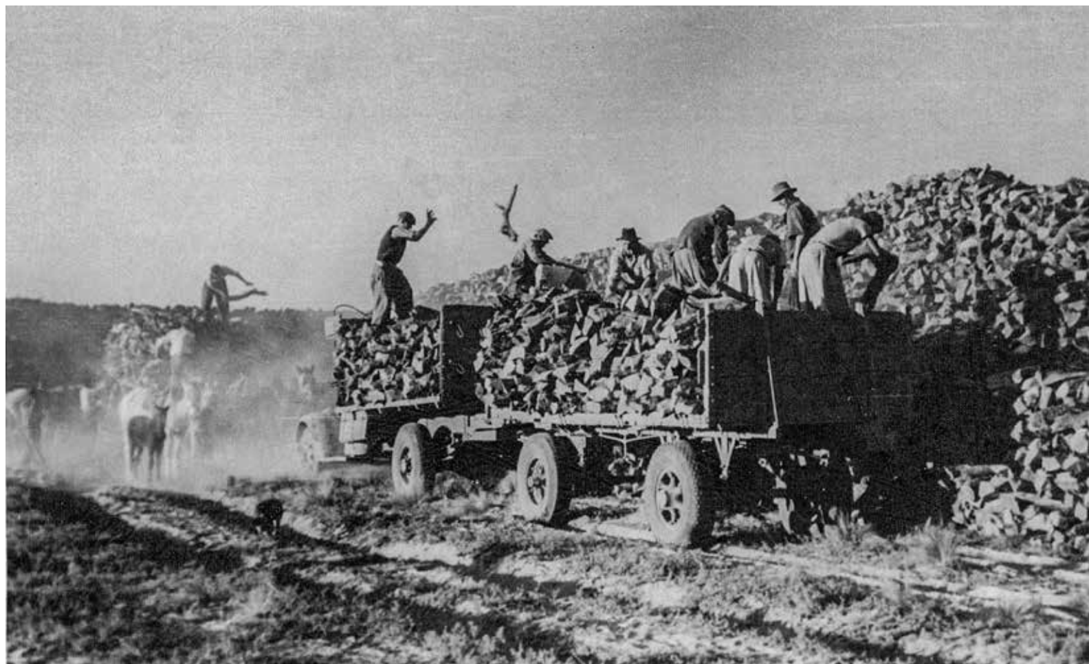
Formando pilas de leña.