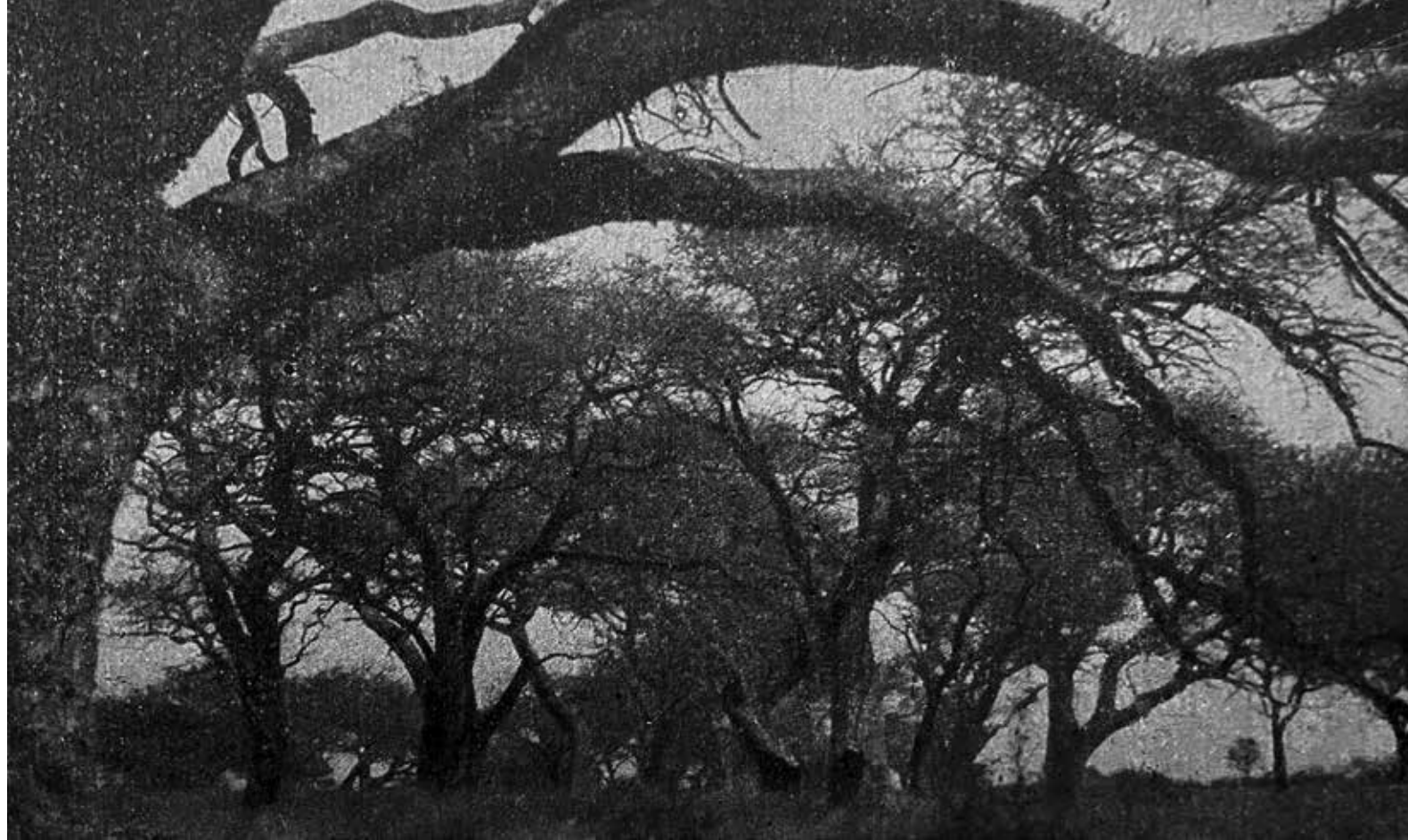
Fotografía del bosque de caldenes, del padre Juan Víctor Monticelli, Far West Argentino , 1933.